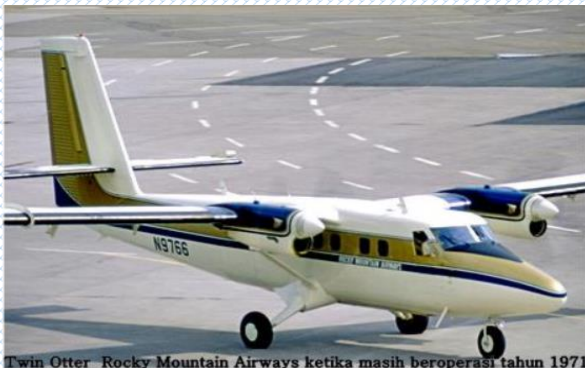
Twin Otter Rocky Mountain Airways ketika masih beroperasi tahun 1971

Dari 22 PoB, 1 pilot meninggal setelah dirawat 3 hari di rumah sakit dan seorang penumpang meninggal setelah 4 jam kecelakaan terjadi. Maskapai ini mengakhiri operasinya pada 1991.