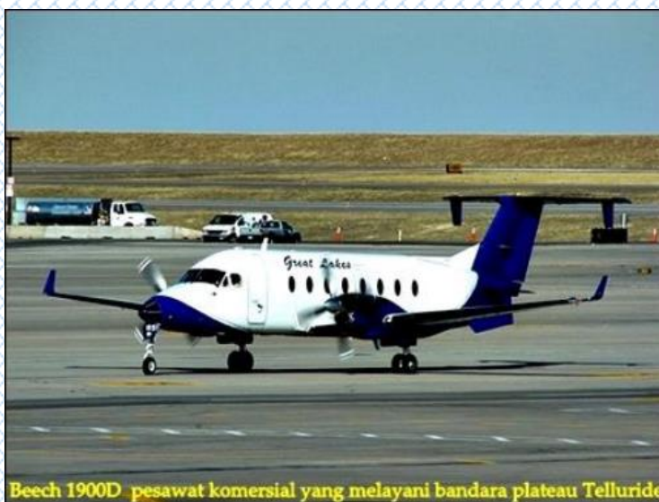
Beech 1900D pesawat komersial yang melayani bandara plateau Telluride

Bandar udara yang terletak di ketinggian selain disebut sebagai high elevation aerodrome oleh otoritas tertentu juga disebut sebagai Plateau Airport. Data dari CAAC (Civil Aviation Administration of China), menunjukkan bahwa bandar udara plateau sebagian besar berada di sekitar pegunungan Himalayas, Asia dan pegunungan Andes di Amerika Latin yang memiliki puncak tertingginya yang terkenal, Aconcagua ( \pm 22.841 kaki). Ilaga adalah salah satu bandar udara di Papua yang berada di ketinggian lebih dari 7.000 kaki.