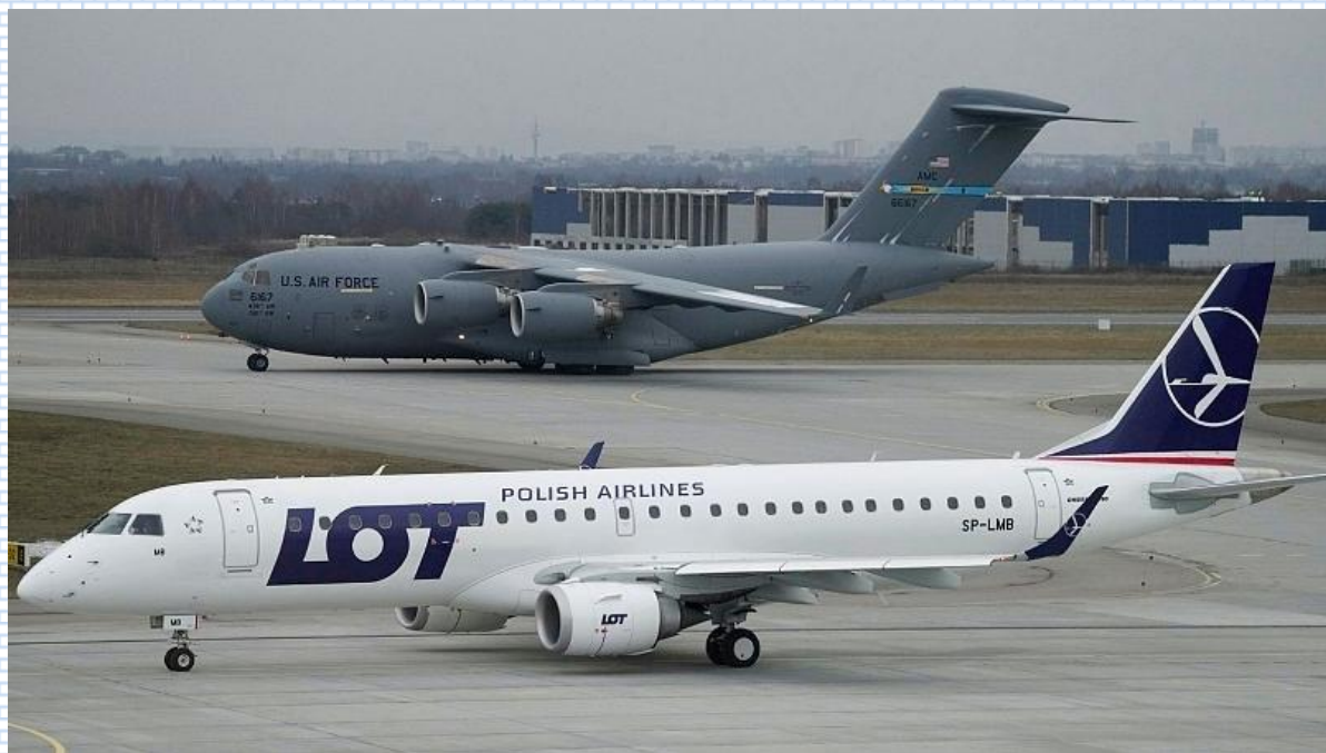
Sebuah pesawat US Air Force mendarat di Rzeszow-Jasionka airport selatan Polandia awal bulan ini.

Ditanya apakah penerbangan ke dan dari Polandia selamat, dijawab oleh maskapai ini bahwa semua penerbangannya yang masih berlangsung tetap sesuai dengan jadwal seperti biasa. Disarankan setiap penumpang yang akan mempergunakan maskapai LOT Polish Airlines agar menghubungi melalui WhatsApp dan telepon atau melalui webpage ini.