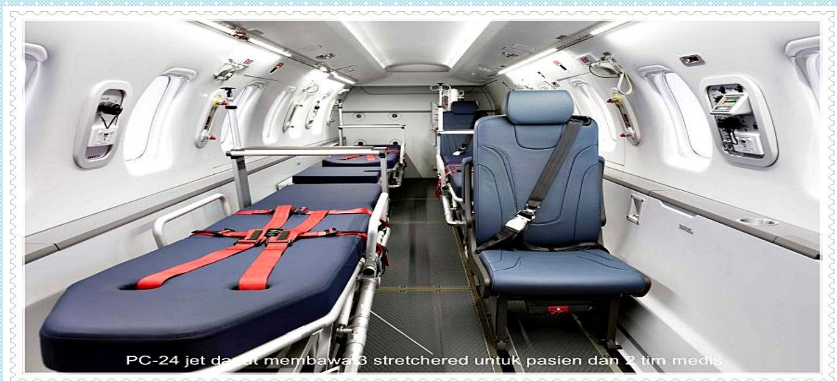
PC-24 jet dapat membawa 3 stretchered untuk pasien dan 2 tim medis

Pabrik pesawat Pilatus, Swis, khusus mendesain kelengkapan 3 pesawat jenis PC-24 bermesin ganda jet untuk kepentingan RFDS, dengan biaya sebesar AU$13 juta. Bandar udara Broome dan Jandakot (Perth) menjadi pangkalan 2 pesawat jet tersebut. Jet ke-3 ditempatkan di Adelaide pada Februari 2019. PC-24 adalah jenis private jet pertama yang dilengkapi dengan cargo door, sehingga memudahkan keluar masuknya ke-3 stretchers (tempat berbaring pasien).